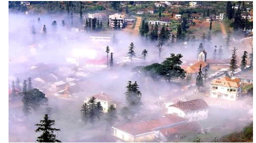
Sunny Mountain hotel***